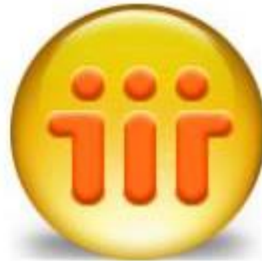
IBM Lotus Notes