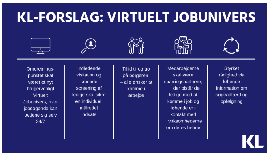
Figur 1. KL-FORSLAG: VIRTUELT JOBUNIVERS

Et Virtuelt Jobunivers kan omfatte muligheden for at stille spørgsmål 24/7 og chatte med en jobcentermedarbejder. Mulighed for at sammensætte lige præcis dét forløb, der passer til ens behov. Løbende push-beskeder med fx mulige job. Og personlige samtaler, når der i fællesskab med jobcentermedarbejderen vurderes at være et behov.