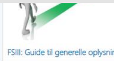
FSIII: Guide til generelle oplysninger