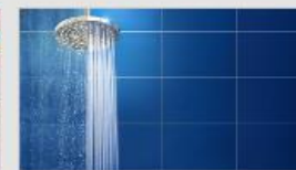
Problemer med personlig pleje - eksempel