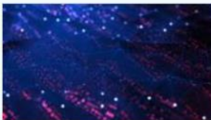
Sprog og adfærd i dokumentation