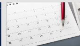
Methotrexat - eksempel