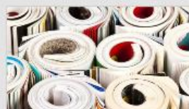
AK behandling - eksempel