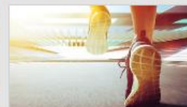
Problemer med mobilitet og bevægelse - eksempel