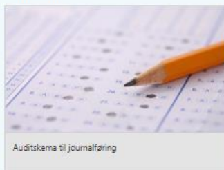
Auditskema til journalføring