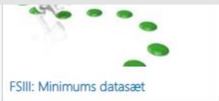
FSIII: Minimums datasæt